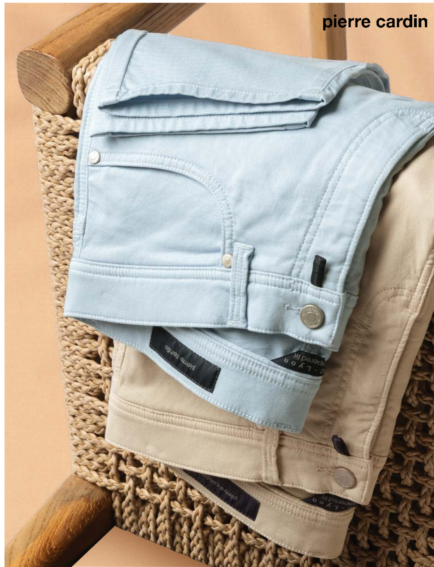
Stretchhosen mit Struktur, je 99,99 € Beide von Pierre Cardin.