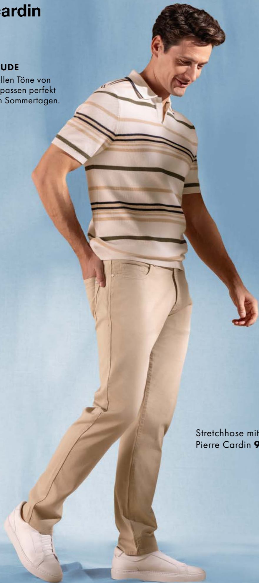
Stretchhose mit Struktur Pierre Cardin 99,99 €

Die leichten, hellen Töne von Polo und Hose passen perfekt zu genussvollen Sommertagen.