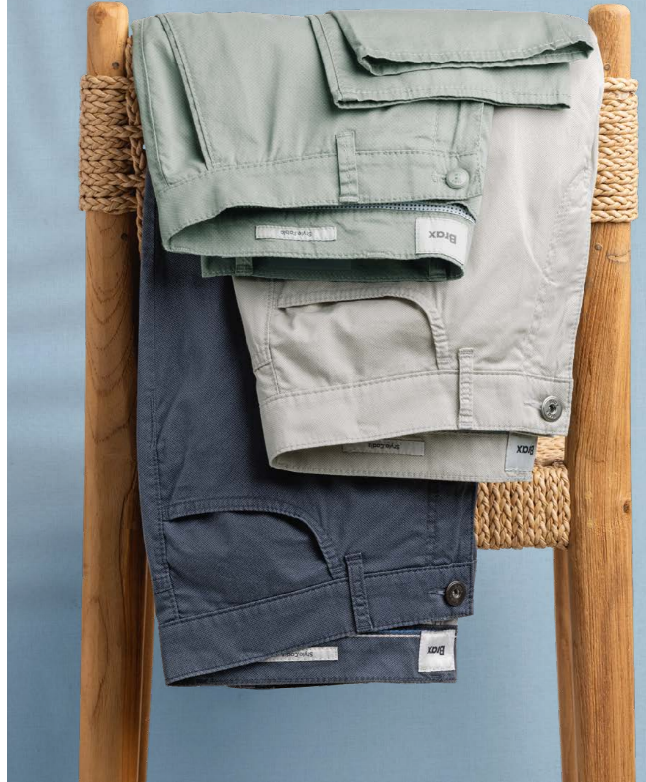
Stretchchino salbei 119,95 € , Stretchhosen grau und marine, je 109,95 € Alle von Brax.