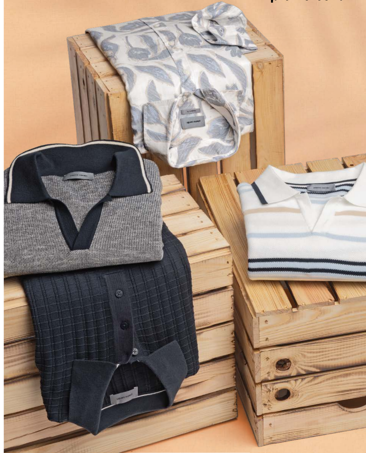
Hemd Baumwolle 59,99 € , Strickpolo links oben 69,99 € , unten und rechts, je 79,99 €