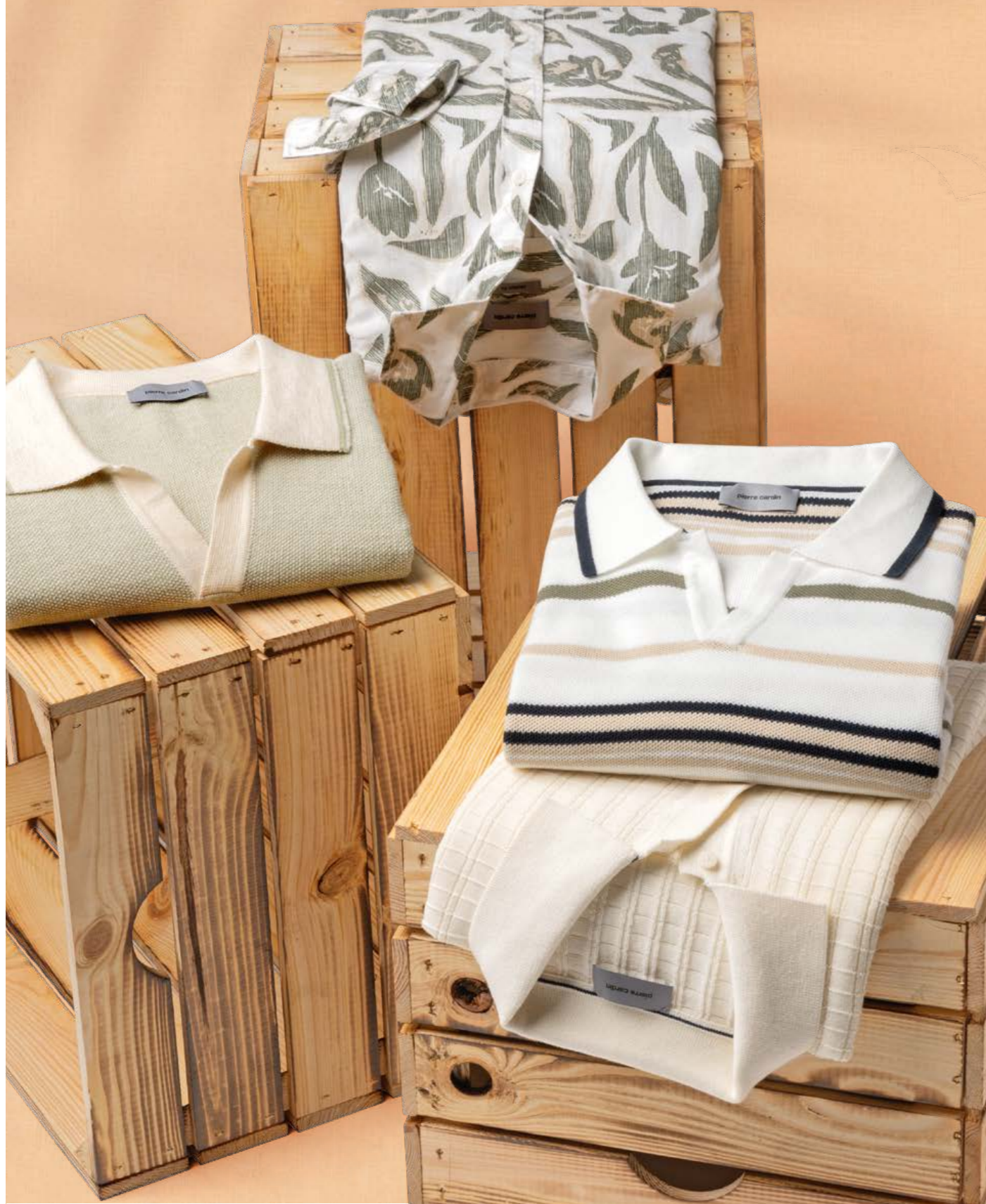
Hemd Baumwolle 59,99 € , Strickpolo links 69,99 € , rechts, je 79,99 €